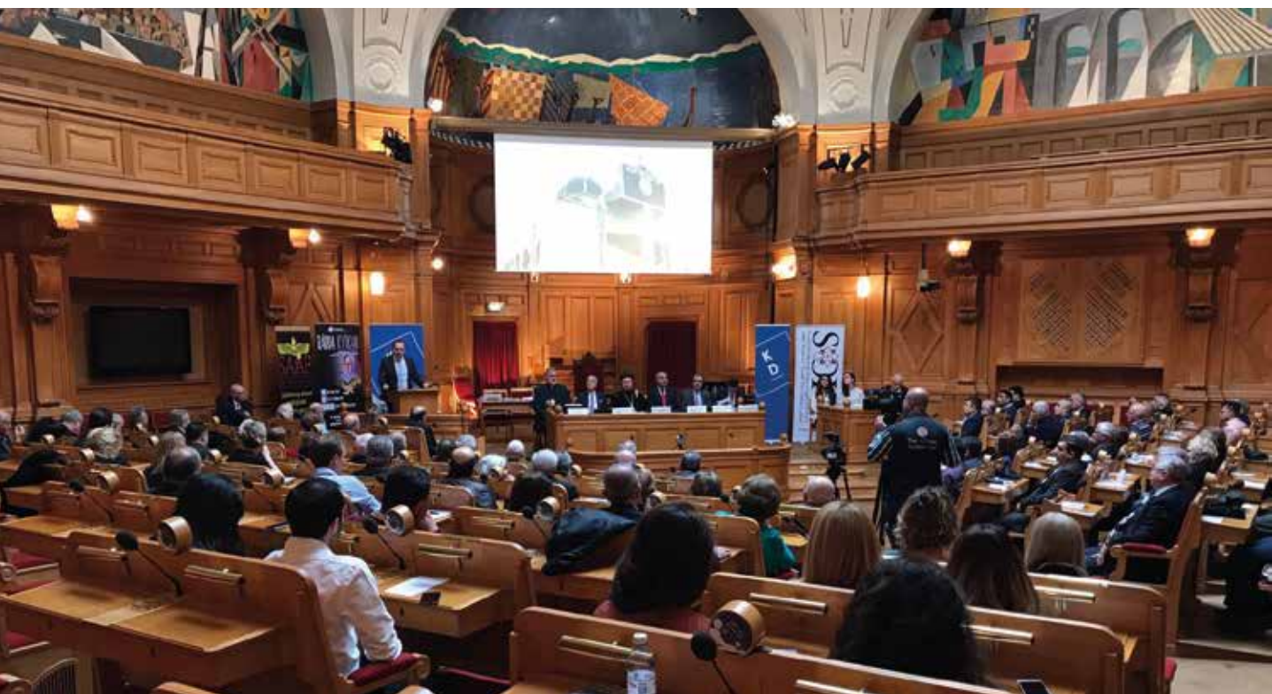
Under ett riksdagsseminarium den 25 april 2017 deltog bland annat experter från Open Doors.