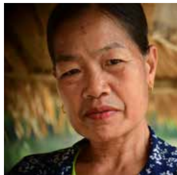
Alani: Hustru och förföljd

”Under det att min man befann sig i fångelse blev han väldigt sjuk och behövde komma till en läkare. Min äldste son följde