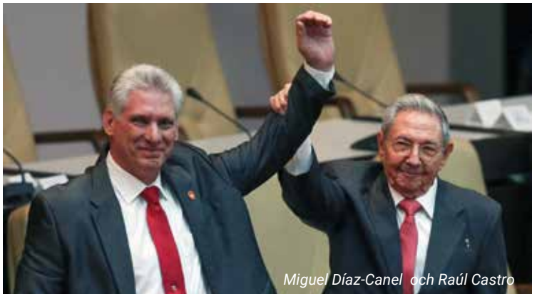
Miguel Díaz-Canel och Raúl Castro

Dessutom har många kyrkor på Cuba fått vänta i mer än två decennier för att få tillstånd för sin verksamhet. Detta har tvingat många kristna att mötas illegalt och därigenom riskera att deras gudstjänstlokaler konfiskeras eller förstörs.