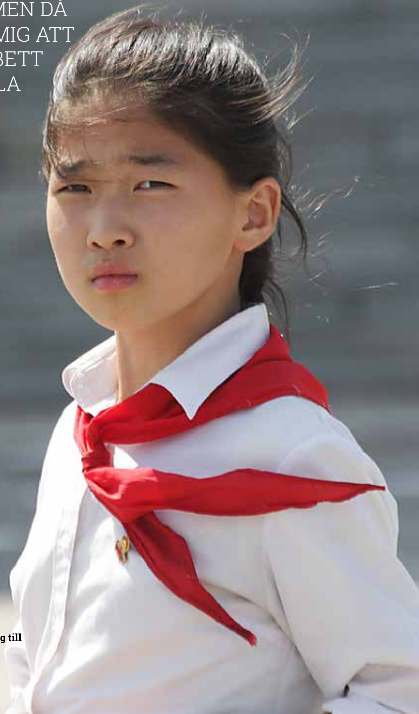
Foto: Kvinnan på bilden har ingen koppling till artikeln.

”JAG TRODDE JAG VAR DEN FÖRSTA I FAMILJEN SOM KOMMIT TILL TRO, MEN DÅ GICK DET UPP FÖR MIG ATT MIN FARFAR HADE BETT FÖR MIG UNDER ALLA DESSA ÅR.”